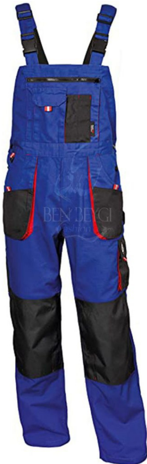
دوبندہ کار | پارچہ پنبنہ ای رنگ آبی مشکی | کد ۱۵۰۹۷