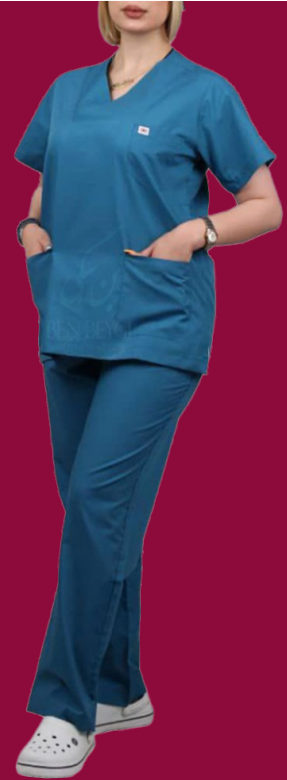
اسکراب شلوار زنانه پارچه ترگال | رنگ آبی کد: ۱۵۷-۲۳۶۰۸