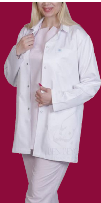
روپوش پزشکی زنانه پارچه ترگال | رنگ سفید کد: ۴۲۰-۲۳۵۸۲