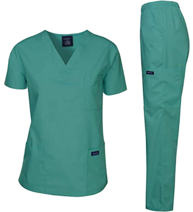
اسکراب شلوار زنانه | اتاق عمل پارچه ترگال | رنگ سبز کد: ۹۸۴۹