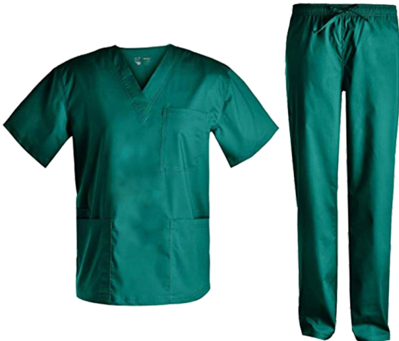
اسکراب شلوار مردانه | اتاق عمل پارچه ترگال | رنگ سبز کد: ۹۸۵۱