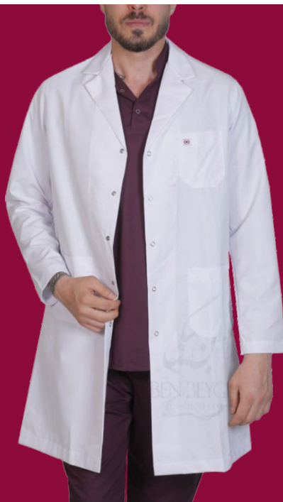
روپوش پزشکی مردانه پارچه ترگال | رنگ سفید کد: ۴۲۱-۲۳۵۸۶