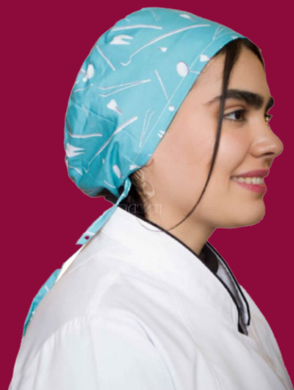
کلاه پزشکی | طرح دندان بند سر قابل تنظیم کد: ۲۵۱۵۲