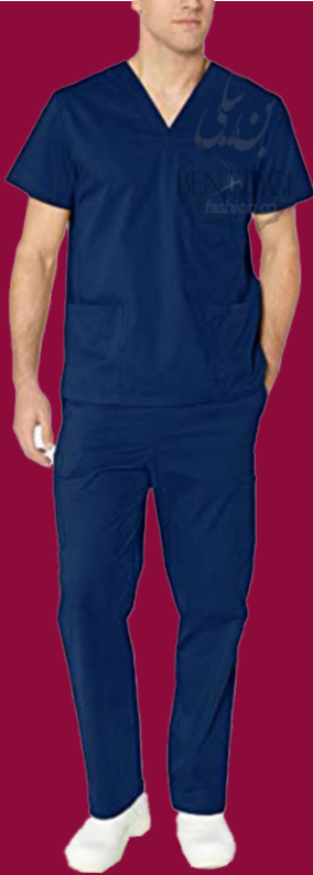
اسکراب شلوار مردانه پارچه ترگال | رنگ آبی کد: ۹۷۸۲