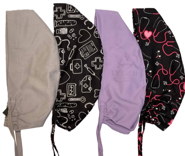
کلاه پزشکی | ساده و طرح دار بند قابل تنظیم | پارچه ترک کد: ۲۳۶۵۹