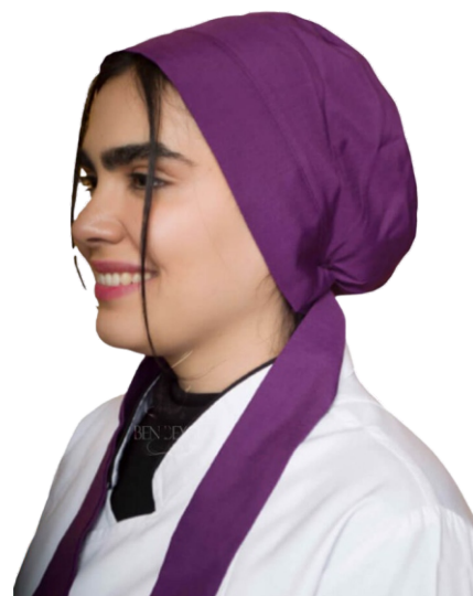
کلاه پزشکی | رنگ بنفش بند سر قابل تنظیم کد: ۲۵۱۵۰