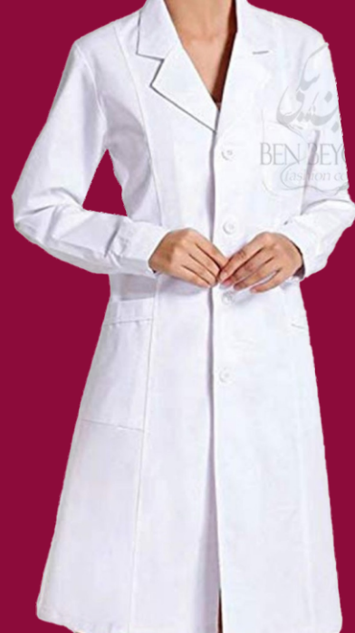
روپوش پزشکی زنانه پارچه ترگال | رنگ سفید کد: ۹۹۶۱