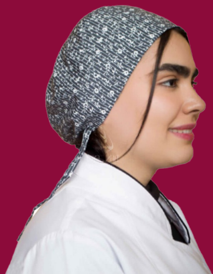
کلاه پزشکی | طرح گل بند سر قابل تنظیم کد: ۲۵۱۵۳