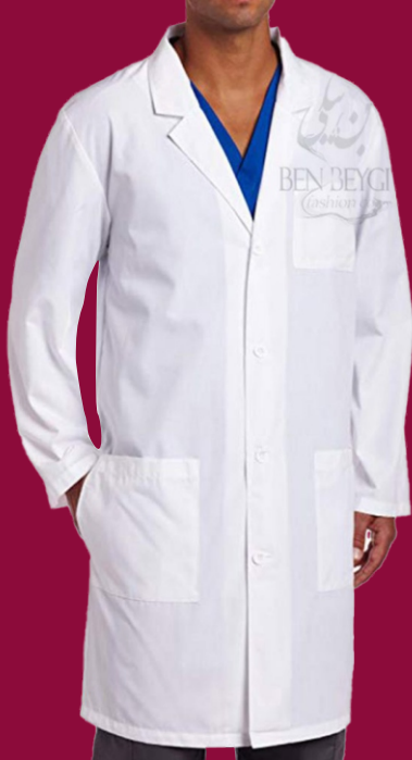
روپوش پزشکی مردانه پارچه ترگال | رنگ سفید کد: ۹۹۶۳